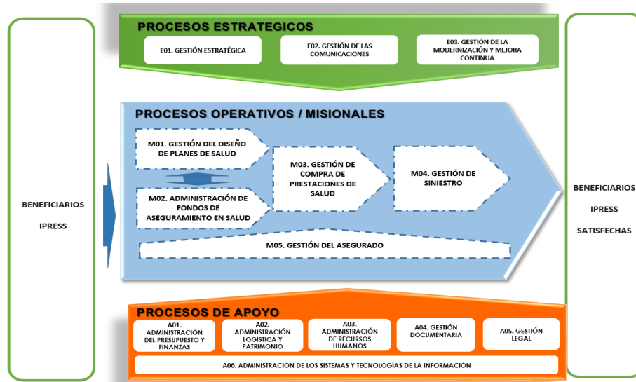
Ilustración 1: MAPA DE PROCESO - SALUDPOL